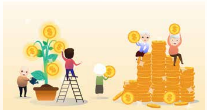
...นายสินเชื้อ...

แต่หากสมาชิกทำรายการเกิน 30 วันไปแล้ว สมาชิกจะสามารถซื้อหุ้นได้เดือนละ 1 ครั้ง ครั้งละไม่เกิน 100,000 บาท แต่สำหรับเงินฝาก สมาชิกจะไม่สามารถฝากในบัญชีออมทรัพย์พิเศษสุขเกษียณได้ แต่สามารถนำไปฝากในบัญชีประเภทอื่นๆ ได้อยู่ครับ